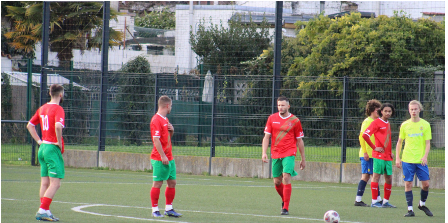
Union Sportive Portugaise de Roubaix Tourcoing / US Noeux-Les-Mines - 24/11/2024